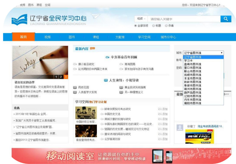
全民学习中心网页