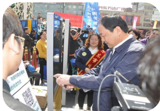
丹东馆读书节活动