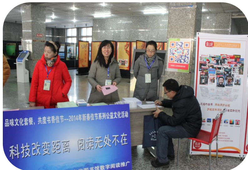
科技改变距离 阅读无处不在