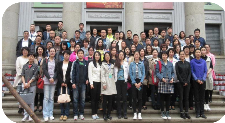
2015年地市级公共图书馆技术骨干培训班