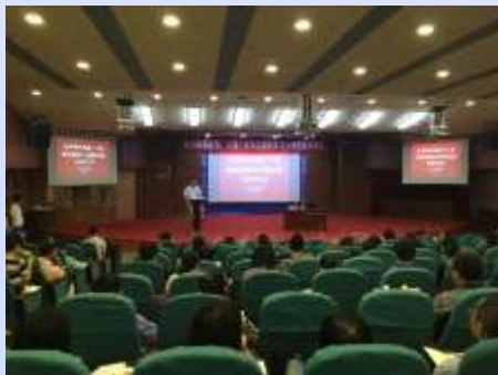
国家图书馆在我省举办推广工程舆情监测与分析培训班