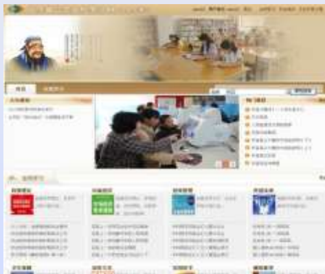
山东省公共文化学习网