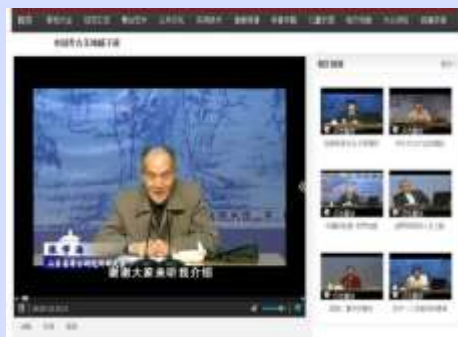
大众讲坛图书馆公开课