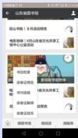
山东省图书馆微信服务号