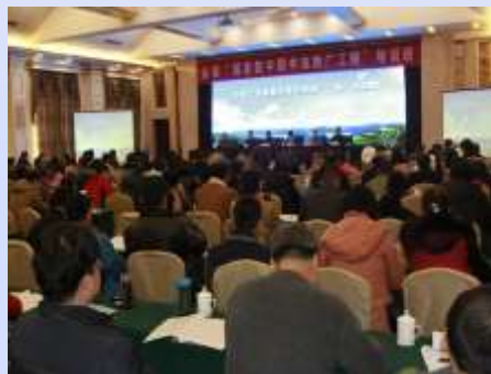
2015年12月，全省数图推广工程培训班在临沂举办。