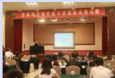
2015年全省特色资源建设培训班在 枣庄举办