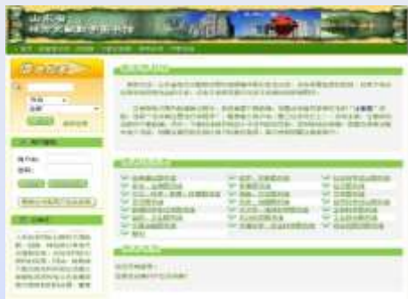
山东地方文献数字图书馆