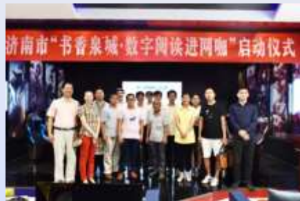
济南市图书馆开展“书香泉城·数字阅读进网咖”活动。