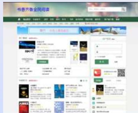
书香齐鲁全民阅读平台