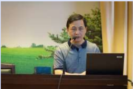
2016年5月全省盲人数字图书馆培训班在济南举办