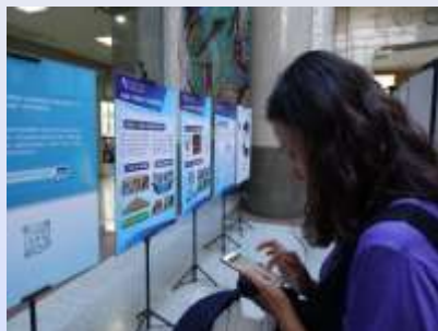
山东省图书馆举办的推广工程体验展示活动。