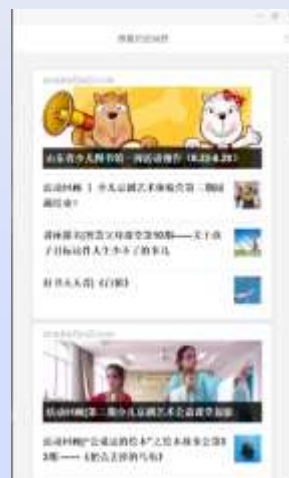
山东省少儿图书馆微信

•为顺应读者信息交流方式的变化，山东省图书馆创新服务模式，搭建包含微信、微博、官网APP、以及QQ群在内的微服务平台，向读者提供及时、便捷的网络服务。目前拥有一个官网微信服务号、一个官网订阅号，一个官方微博、一个官网APP，以及尼山书院、少儿图书馆、培训中心、志愿者等微信号。除发布活动资讯外，还提供书目检索、图书续借、书刊微阅读等服务。截至2016年8月，山东省图书馆微服务平台粉丝用户已超过3万名。