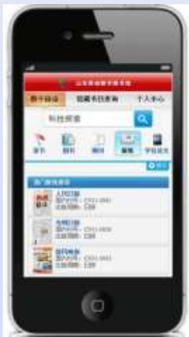
山东移动数字图书馆

•2012年1月，山东移动数字图书馆正式开通。提供馆藏书目数据检索，实现在线书刊阅读。通过后台功能强大的云共享服务体系，提供近5亿条的元数据检索和40TB的资源共享，文献传递功能强大。目前月均点击量达174万次。