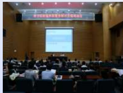
2015年图书馆新媒体新服务展示 交流现场会在潍坊举办