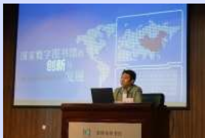
2016年图书馆新媒体新服务交流会 及数字图书馆高层论坛在淄博举办