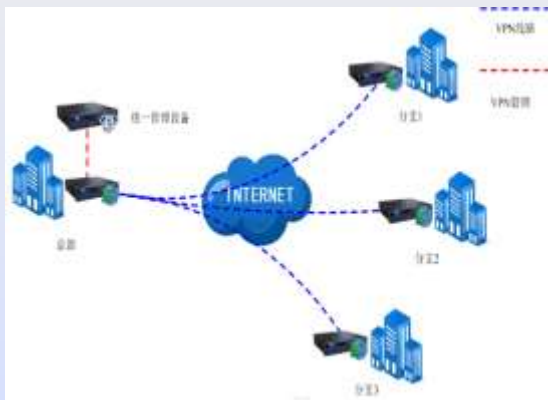
山东省公共图书馆 VPN 网络拓扑图