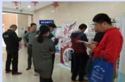
潍坊市图书馆在世界读书日期间开展数字阅读推广活动