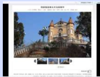
山东近代建筑资源库