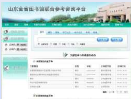
全省图书馆联合参考咨询平台