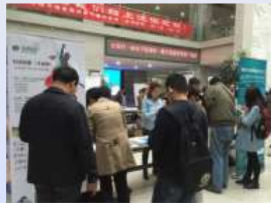
青岛市图书馆：让我们一起电子悦读吧——数字资源使用推广活动