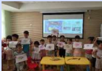
省少儿图书馆举办图书馆数字资源与服务系列讲座。