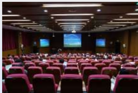
2016年6月全省数字图书馆推广工程培训班在济南举办