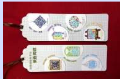
书签、海报、微信：山东省图书馆推广方式多种多样。