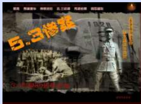
五三惨案多媒体数据库