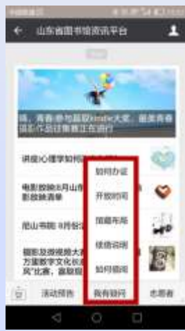
山东省图书馆资讯平台（订阅号）