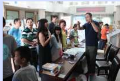
东营市图书馆举办手机移动阅读推广活动