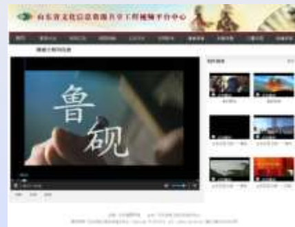
山东民俗文化之旅专题片