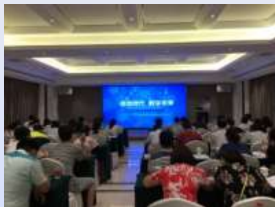
全省图书馆数字化创新服务研讨会暨 2016数字图书馆业务技能竞赛培训班