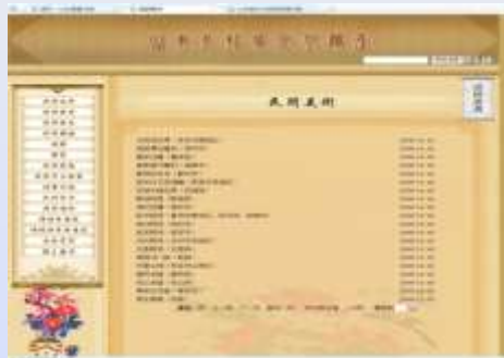
山东非物质文化遗产数据库