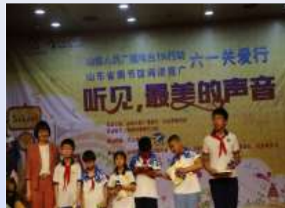
六一儿童节，省图书馆针对残疾儿童开展阅读推广活动。